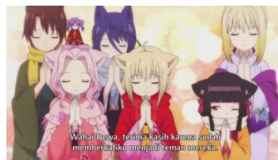
Eps 12, 04.39 (Berdoa di Kuil)

蓮 : この1年を無事に過ごすことができた感謝を伝えに来たのたまに神社に来て身勝手なお願ひするのなんて人間くらいよ。