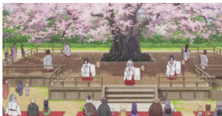
Eps 2, 19:21 (tarian kagura)

町人1 : 大桜が咲いたぞ! 町人2 : うたげじゃ うたげ! 町人3 : 祭りじゃ! 音 : (神楽鈴の音) Chounin 1 : Ōsakura ga saita zo! Chounin 2 : Utage ja! Utage! Chounin 3 : Matsuri ja! Oto : (Kagura suzu no oto) Penduduk 1 : 'Sakura besar telah mekar!' Penduduk 2 : 'Pesta! Pesta!' Penduduk 3 : 'saatnya Festival!' Suara : (Suara lonceng Kagura)