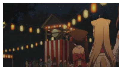
Eps 7. 06:04 (festival bon odori )