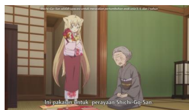
Eps 4, 11:14 ( Shichi-Go-San )