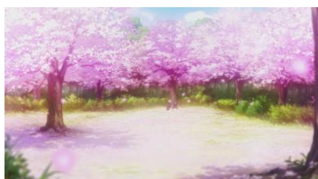
Eps 1 :18.02 hanami