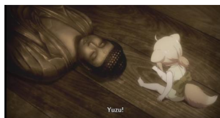
Eps 6 , 15.40 (Patung Buddha)

柚 :あ… 阿弥陀様をお拭きしよ うと… Yuzu : Ah... Amida-sama o fuki shiyou to... Yuzu :‘Aku sedang membersihkan patung Buddha.’