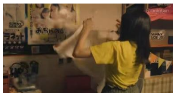
Gambar 2. Ai mencabut foto Sanisai dari dinding kamarnya (Episode 6, 23:09)