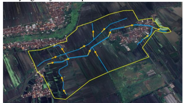
Gambar 2. Saluran di Wilayah Kali Wrtati, Pasuruan

Berikut adalah gambar catchment area dari wilayah Kali Wrtati yang menjadi studi penelitian: