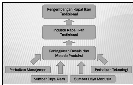
Gambar 2 Transformasi Pembangunan Kapal Kayu

berada. Transformasi pembangunan kapal kayu di Indonesia bisa dilihat pada gambar 2