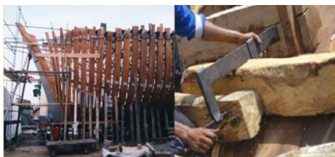
Gambar 1 Konstruksi Gading dan Ukuran Balok Kayu

Kapal kayu yang terdapat di Indonesia kebanyakan digunakan sebagai kapal penangkap ikan dan kapal angkut muatan dengan skala kecil. Dalam proses pembangunan kapal kayu yang ada di galangan-galangan kapal kecil di Indonesia, masih banyak menggunakan teknologi tradisional dan menggunakan perhitungan konstruksi yang turun menurun dari nenek moyang. Pembangunan kapal kayu erat dengan aspek kearifan lokal, sehingga banyak kita dapati setiap kapal kayu yang ada di lautan Indonesia memiliki bentuk dan ukuran konstruksi yang berbeda-beda, dan biasanya memberikan ciri khas asal dari daerah nelayan tersebut. Kapal kayu yang ada saat ini banyak digunakan, cenderung terlihat memiliki konstruksi kayu yang berukuran besar, terlihat kokoh dan cukup berat. Hal ini terlihat dari dimensi konstruksi yang digunakan yaitu menggunakan jenis balok-balok berbahan kayu yang cukup besar, tebal kulit kayu yang besar pula. Dimensi yang cukup besar ini bisa terlihat pada gambar 1 yang menampilkan ukuran dari konstruksi kapal kayu. Ukuran konstruksi yang cukup besar ini tentunya akan membuat volume muatan dari kapal menjadi sangat minim dan terbatas, selain itu juga membuat displacement kapal menjadi besar.