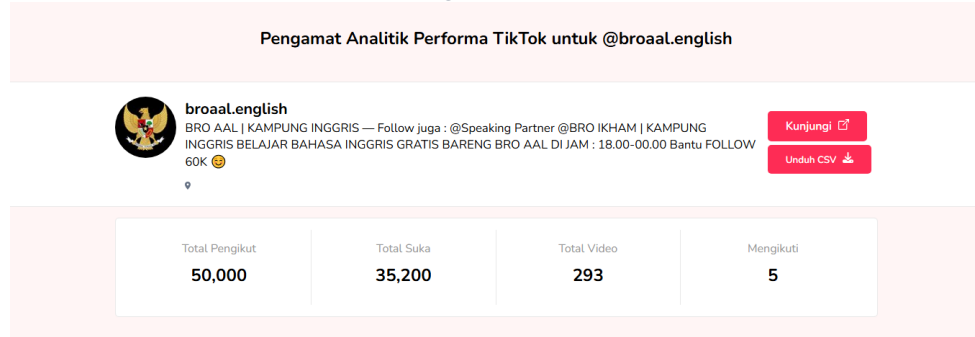
Figure 1 Data Statistik Akun TikTok Broaal English Terbaru

Sumber 1(BRO AAL | KAMPUNG INGGRIS (@broaal.English) TikTok Analitik & Penampil Profil - Countik, 2026)