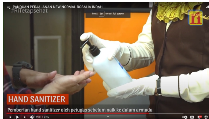
Gambar 4 Petugas Rosalia Indah Memberikan HandSanitizer kepada Penumpang

bagaimana penumpang ingin merasa aman dan berusaha menjalankan semua protokol secara baik.