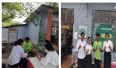
Gambar 1 Wawancara dengan Narasumber

Analisis data dalam penelitian ini dilakukan dengan menggunakan teknik kuantitatif dan kualitatif. Analisis kuantitatif digunakan untuk menghitung estimasi waktu dan jalur kritis dalam produksi dan pemasaran produk daun kelor dengan menggunakan rumus yang telah disebutkan sebelumnya. Data numerik yang diperoleh dari estimasi waktu setiap aktivitas dianalisis untuk menentukan jalur kritis dan memprediksi waktu penyelesaian produksi dan pemasaran produk daun kelor. Sementara itu, analisis kualitatif dilakukan dengan menganalisis hasil wawancara dengan pemilik Moza Cafe, yang disusun secara deskriptif untuk memahami konteks operasional dan tantangan yang dihadapi dalam produksi dan pemasaran produk berbasis daun kelor. Pendekatan ini memungkinkan peneliti untuk menggali faktor-faktor yang mempengaruhi efisiensi dan efektivitas strategi yang diterapkan dalam menghadapi tantangan pasar dan operasional [12][13].