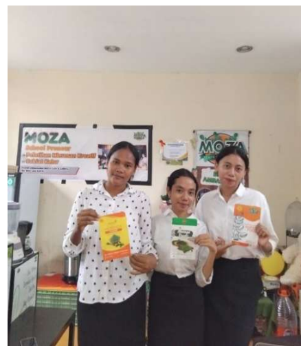
Gambar 6 Varian Kemasan Bubuk Kelor

Proses pengolahan daun kelor menjadi bubuk dilakukan melalui beberapa tahapan yang saling berkaitan. Setiap tahapan dilakukan dengan pengawasan langsung dari Bapak Frans Tio Keban untuk menjaga kualitas akhir produk. Tahapan pertama adalah persiapan daun kelor, dimulai