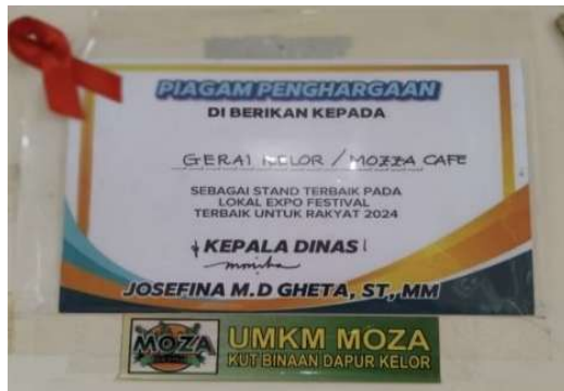
Gambar 4: Piagam Penghargaan