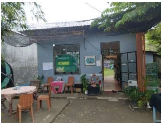
Gambar 2 : Moza Cafe

Moza Cafe merupakan usaha mikro kecil dan menengah (UMKM) yang dirintis oleh Bapak Frans Tio Keban pada tahun 2019 di Kota Kupang, Nusa Tenggara Timur. Usaha ini muncul sebagai respons terhadap program pemerintah yang sedang menggalakkan pemanfaatan daun kelor sebagai salah satu solusi untuk menangani permasalahan stunting dan meningkatkan ekonomi masyarakat. Melalui pelatihan dan pembinaan dari pemerintah, para pelaku UMKM termasuk Moza Cafe mulai mengembangkan berbagai produk berbahan dasar kelor. Moza Cafe fokus pada pengolahan hasil panen daun kelor yang diterima dari para petani dan diolah di kafe serta galeri menjadi produk siap konsumsi dan siap jual. Visi dari Moza Cafe adalah menjadi pusat inovasi produk berbasis daun kelor yang dikenal secara nasional, dengan filosofi mendasar untuk memanfaatkan sumber daya lokal secara optimal demi kesehatan dan kesejahteraan masyarakat. Hal ini terlihat dari kesungguhan dalam proses produksi yang dilakukan secara mandiri, ketat, dan menjaga kualitas pada setiap tahap.