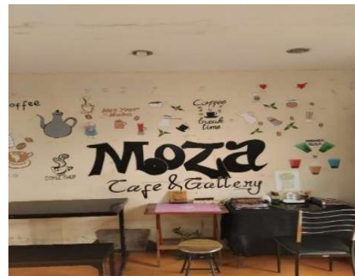
Gambar 5: Ruangan Moza Cafe

Produk-produk yang dihasilkan Moza Cafe dari bahan dasar daun kelor terdiri atas Kopi Kelor, Masker Muka Kelor, dan Cemilan Kelor. Kopi Kelor merupakan campuran antara kopi robusta dan bubuk daun kelor yang disangrai serta digiling dengan proporsi tertentu agar cita rasa dan manfaat nutrisinya seimbang. Proses pencampuran dilakukan dengan menyesuaikan selera konsumen. Masker Muka Kelor merupakan produk perawatan kulit yang dibuat dari campuran bubuk daun kelor, tepung beras, dan bubuk kunyit. Masker ini telah melalui uji laboratorium untuk memastikan khasiatnya yang menutrisi, menghidrasi, serta melindungi kulit. Sementara itu, Cemilan Kelor merupakan olahan makanan ringan seperti keripik atau bakwan yang terbuat dari campuran tepung daun kelor, tepung terigu, dan bumbu lainnya. Menurut rekomendasi medis, komposisi bubuk kelor dalam adonan cukup sebesar 10% untuk memberikan nilai gizi yang optimal.