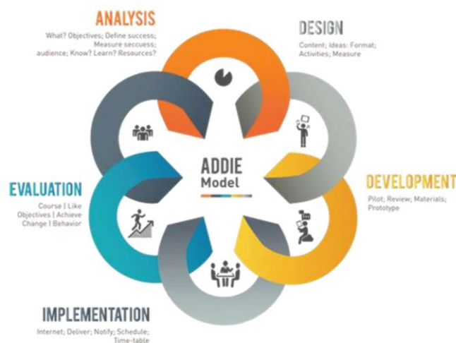
Gambar 1 Tahapan ADDIE

Penelitian menggunakan Research and Development (R&D) dengan model pengembangan ADDIE yang meliputi 5 tahapan utama, yaitu: (1) analysis (Analisis); (2) Design (Perancangan); (3) Development (Pengembangan); (4) Implementation (Implementasi); dan (5) Evaluation (Evaluasi). Lebih jelasnya lihat Gambar 1.