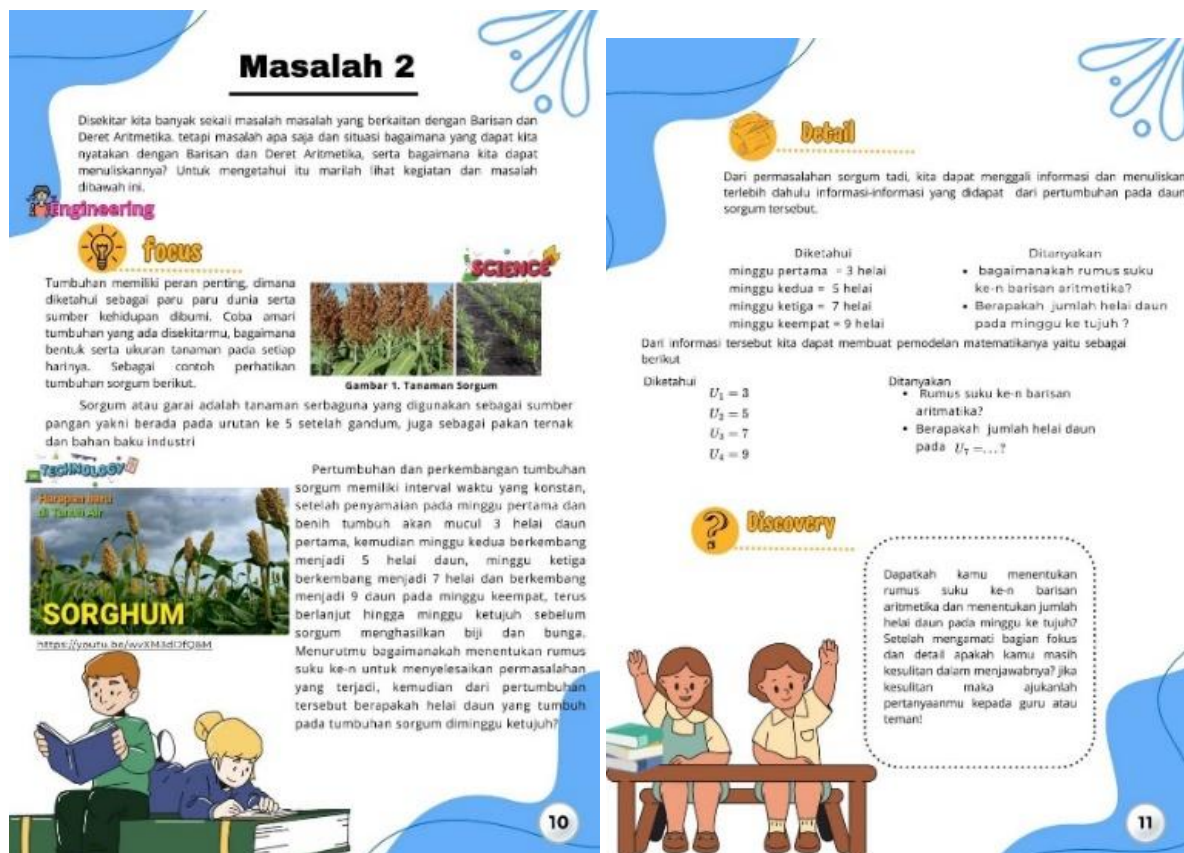
Gambar 3 langkah Pendekatan STEAM dalam E-Modul