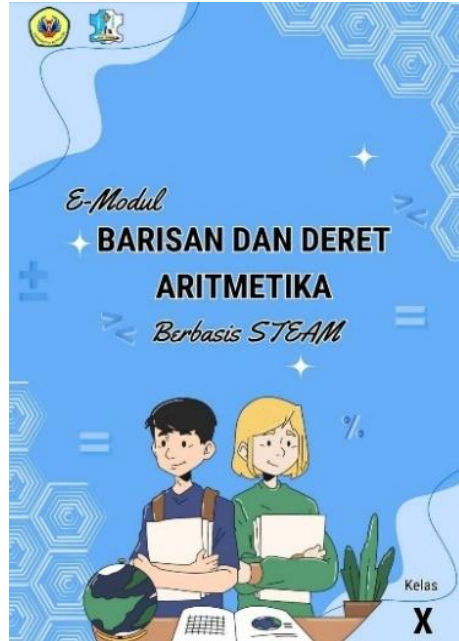
Gambar 2 Cover

Gambar 2 dan Gambar 3 berikut ini merupakan tampilan dari beberapa komponen yang tercantum pada E-Modul yang dikembangkan.