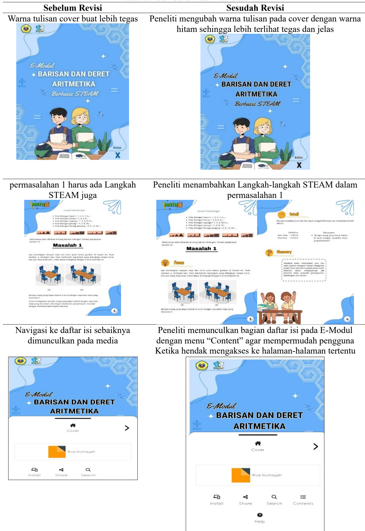
Tabel 9 Masukan dan Saran Validator Masukan dan Saran dari Validator