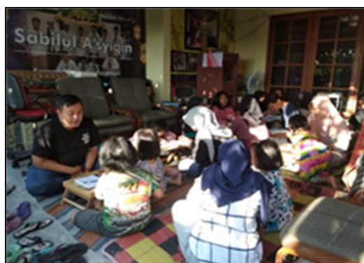
Gambar 6. Kegiatan Sinau Bareng