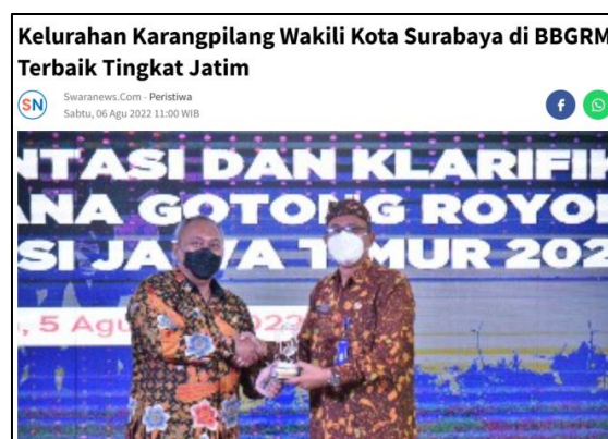
Gambar 8. Kejuaraan BBGRM melalui Program Sinau Bareng

memfasilitasi jalannya program, mulai dari penyediaan tempat, pengorganisasian kegiatan, hingga pengawasan terhadap pelaksanaan kegiatan yang dilakukan di lapangan.