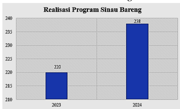
Tabel 1. Realisasi Titik Balai RW Program Sinau Bareng

menjadi fasilitator dalam kegiatan ini. Namun, pada tahap awal pelaksanaan, beberapa tantangan muncul, seperti kurangnya motivasi mahasiswa yang belum memahami manfaat program ini, keterbatasan fasilitas pengajaran, serta kesulitan beradaptasi dengan lingkungan baru. Mengatasi kendala ini membutuhkan perencanaan matang, pelatihan peserta, dan komunikasi yang efektif di antara semua pihak terkait (Sajidah et al., 2024). Dengan perencanaan dan pelaksanaan yang tepat, Sinau Bareng memiliki potensi besar untuk menjadi model pembelajaran komunitas yang mampu mengatasi berbagai tantangan pendidikan. Program ini juga menekankan pentingnya monitoring dan evaluasi yang dilakukan secara berkala oleh penyelenggara kegiatan, tokoh masyarakat, dan pemerintah daerah agar tujuan yang telah ditetapkan dapat tercapai dengan optimal (Kamaliya & Anshori, 2024).