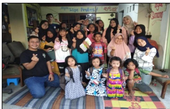
Gambar 9. Partisipasi Masyarakat dan Pemerintah dalam Program Sinau Bareng

Pada tahap awal implementasi program Sinau Bareng , banyak mahasiswa yang kurang memahami sepenuhnya manfaat yang bisa mereka peroleh dari berkolaborasi dalam kegiatan ini. Sebagian dari mereka datang dengan anggapan bahwa program ini hanya sekadar kegiatan sosial tanpa tujuan akademik yang jelas. Hal ini menyebabkan rendahnya motivasi mereka untuk berpartisipasi secara aktif. Untuk mengatasi hal ini, diperlukan pendekatan yang lebih sistematis dalam memberikan pemahaman tentang tujuan jangka panjang program, baik bagi mahasiswa maupun masyarakat. Program ini tidak hanya bermanfaat bagi anak-anak yang diajar, tetapi juga memberi pengalaman berharga kepada mahasiswa dalam mengembangkan keterampilan sosial, komunikasi, dan kepemimpinan.