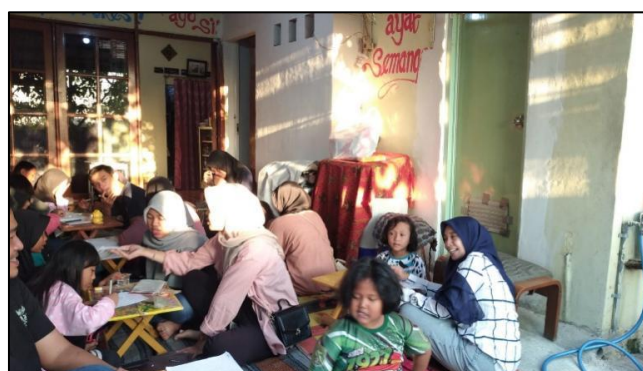
Gambar 7. Antusias Anak Anak dalam Belajar

Peran fasilitatif pemerintah terlihat jelas dalam memberikan dukungan logistik dan membuka ruang diskusi untuk merespons masukan dari masyarakat. Dalam proses kolaborasi dan partisipasi, Partisipasi masyarakat menjadi aspek penting dalam keberhasilan program ini