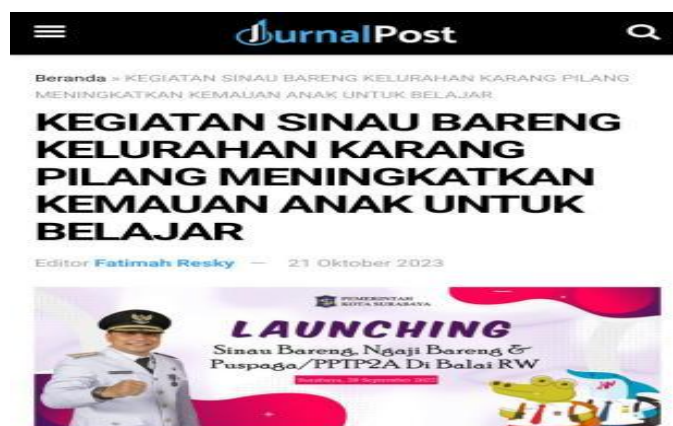
Gambar 4. Liputan Kegiatan Sinau Bareng

pendidikan dan kualitas pembelajaran bagi siswa melalui pendekatan berbasis komunitas. Program ini diselenggarakan di Balai RW dengan melibatkan mahasiswa, guru, serta masyarakat sebagai tenaga pendamping belajar secara sukarela. Sinau Bareng dirancang untuk menciptakan lingkungan belajar yang inklusif dan kondusif, di mana siswa mendapatkan bimbingan akademik maupun pembelajaran keagamaan melalui sesi Ngaji Bareng . Program ini tidak hanya berfungsi sebagai upaya peningkatan literasi dan numerasi, tetapi juga sebagai strategi pemberdayaan masyarakat dalam mendukung pendidikan berbasis gotong royong. Dengan jadwal yang terstruktur dan penyebaran di berbagai wilayah Surabaya, Sinau Bareng menjadi salah satu bentuk implementasi kolaboratif dalam pendidikan yang mengoptimalkan peran serta masyarakat dalam mendukung perkembangan akademik dan karakter peserta didik.