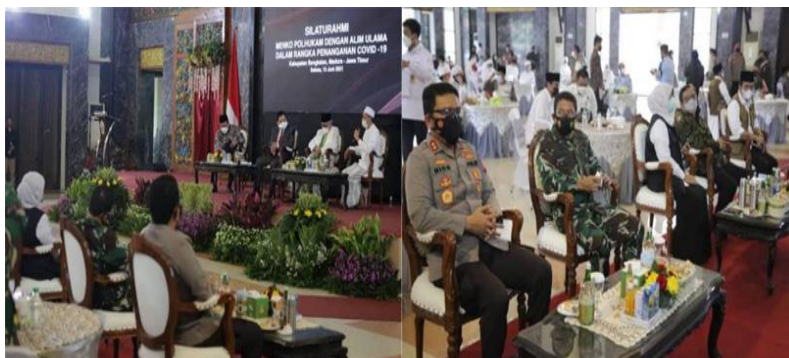
Gambar 2: Pertemuan bersama Menkopolhukam dengan Ulama di Kabupaten Bangkalan.