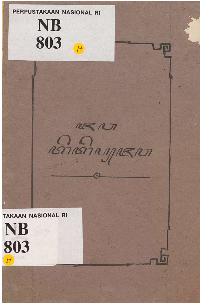
Gambar 2. Isi Naskah