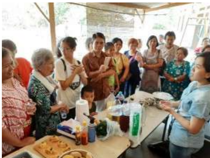
Gambar 4. Pembicara ketiga memberikan materi

optimalisasi media sosial dalam hal promosi dan difusi informasi secara terintegrasi dalam suatu strategi komunikasi pemasaran (Ulfa & Marta, 2016). Selain bertujuan memberi informasi lengkap, cara tersebut akan lebih efektif pula mendatangkan wisatawan dari mancanegara (Hidayat & Maryani, 2019).