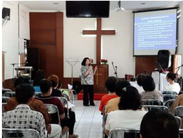
Gambar 2. Pembicara Pertama Memaparkan Materi

rupa tata cara beribadah dan tempat ziarah (Widyastuti, 2017). Hal ini pula menjadi modal sekaligus potensi Indonesia keanekaragaman agama dan keyakinan yang dilindungi oleh Pancasila sebagai dasar negara (Marta, 2015).