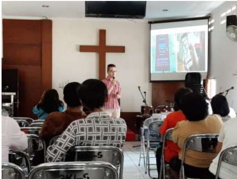
Gambar 3. Pembicara Kedua Memaparkan Materi

budaya serta kebanggaan identitas milik Bangsa Indonesia (Marta, 2017b).