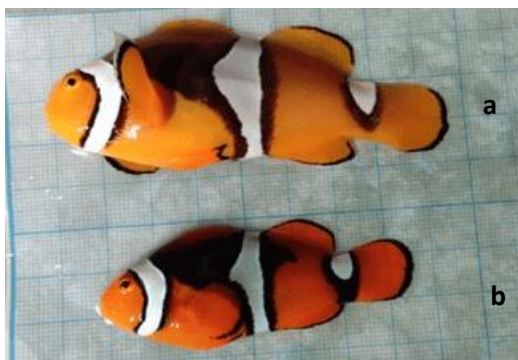
Gambar 3. Induk Ikan Badut Biak (A) Induk Ikan Betina (B) Induk Ikan Jantan

dominan. Seiring waktu, jaringan ovarium berkembang sementara testis menyusut, hingga pada usia tua gonad didominasi oleh ovarium yang aktif (Yuniar, 2017).