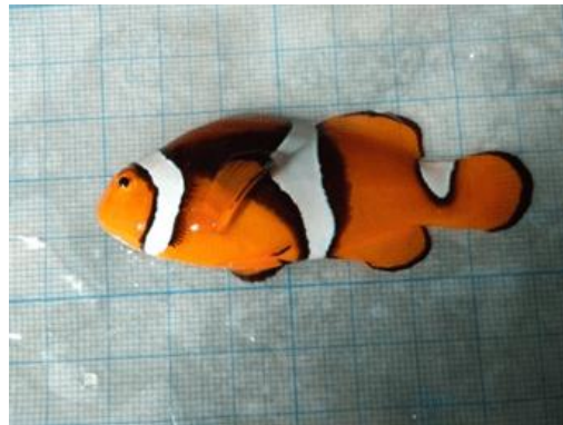
Gambar 1. Ikan Badut Biak Amphiprion percula

Salah satu jenis ikan hias air laut yang memiliki permintaan tinggi adalah ikan badut biak ( Amphiprion percula ), yang termasuk dalam kelompok clownfish (Gambar 1). Dalam publikasinya, Priono (2018) menyebutkan bahwa tingginya permintaan terhadap clownfish termasuk ikan badut biak, baik di pasar lokal maupun internasional, menyebabkan peningkatan penangkapan di alam secara tidak terkendali. Oleh karena itu, diperlukan upaya budidaya untuk menjaga kelestariannya sekaligus memenuhi permintaan pasar. Sejak tahun 2007, telah dilakukan domestikasi calon induk dan pemijahan dari induk alami hingga generasi pertama (G-1) (Ari et al. 2008). Untuk memperoleh induk unggul, dilakukan seleksi benih berdasarkan beberapa kriteria, di antaranya berasal dari induk yang berkualitas, memiliki tingkat kelangsungan hidup ( survival rate /SR) yang tinggi, serta memiliki tingkat kecacatan yang rendah (Purnama, 2016).