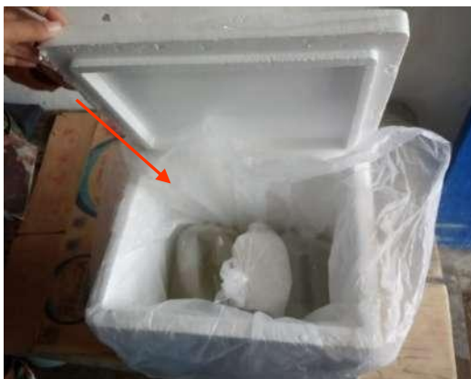
Gambar 5. Benih yang telah Dikemas dan Dimasukkan Ke Dalam Kotak Styrofoam

Merujuk pada Iskandar et al (2024), bahwa pemanenan dilaksanakan pada pagi hari dengan cara menurunkan volume air akuarium sebanyak 80%. Benih selanjutnya ditangkap menggunakan serokan dan dipindahkan ke dalam wadah 'rombong' kecil dengan diameter 15 cm untuk proses selanjutnya. Berdasarkan hasil penghitungan, persentase laju kehidupan benih selama kegiatan pemeliharaan mencapai angka 95,56%.