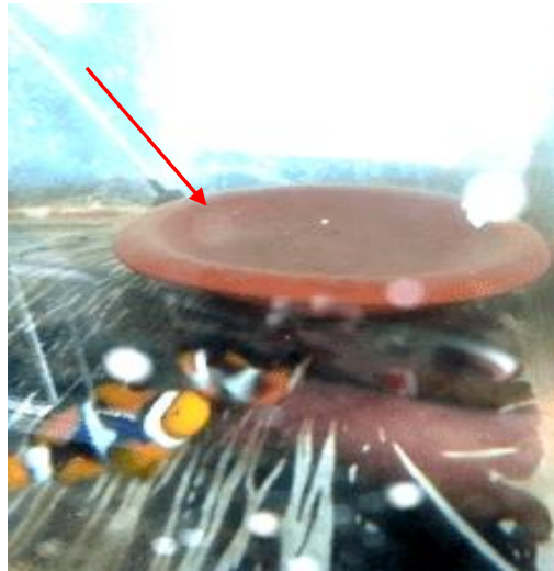
Gambar 2. Pasangan Induk yang Sudah Berjodoh (Tanda Panah Menunjukkan Substrat Berupa Gerabah Tanah Liat)

pakan berupa pelet Love Larva (Marubeni Nisshin Feed Co., Ltd. Japan) nomor 6. Ikan yang telah berjodoh biasanya menunjukkan perilaku berenang berdekatan dan mendominasi area anemon. Ikan yang telah berpasangan selanjutnya dipindahkan ke dalam akuarium pemeliharaan induk yang telah dilengkapi dengan substrat berupa gerabah tanah liat untuk tempat meletakkan telur (Gambar 2).