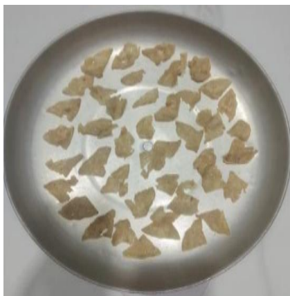
Gambar 1. Kerupuk Cumi-cumi

yang diminati konsumen. Kerupuk cumi-cumi yang siap digoreng dapat dilihat pada gambar 1.