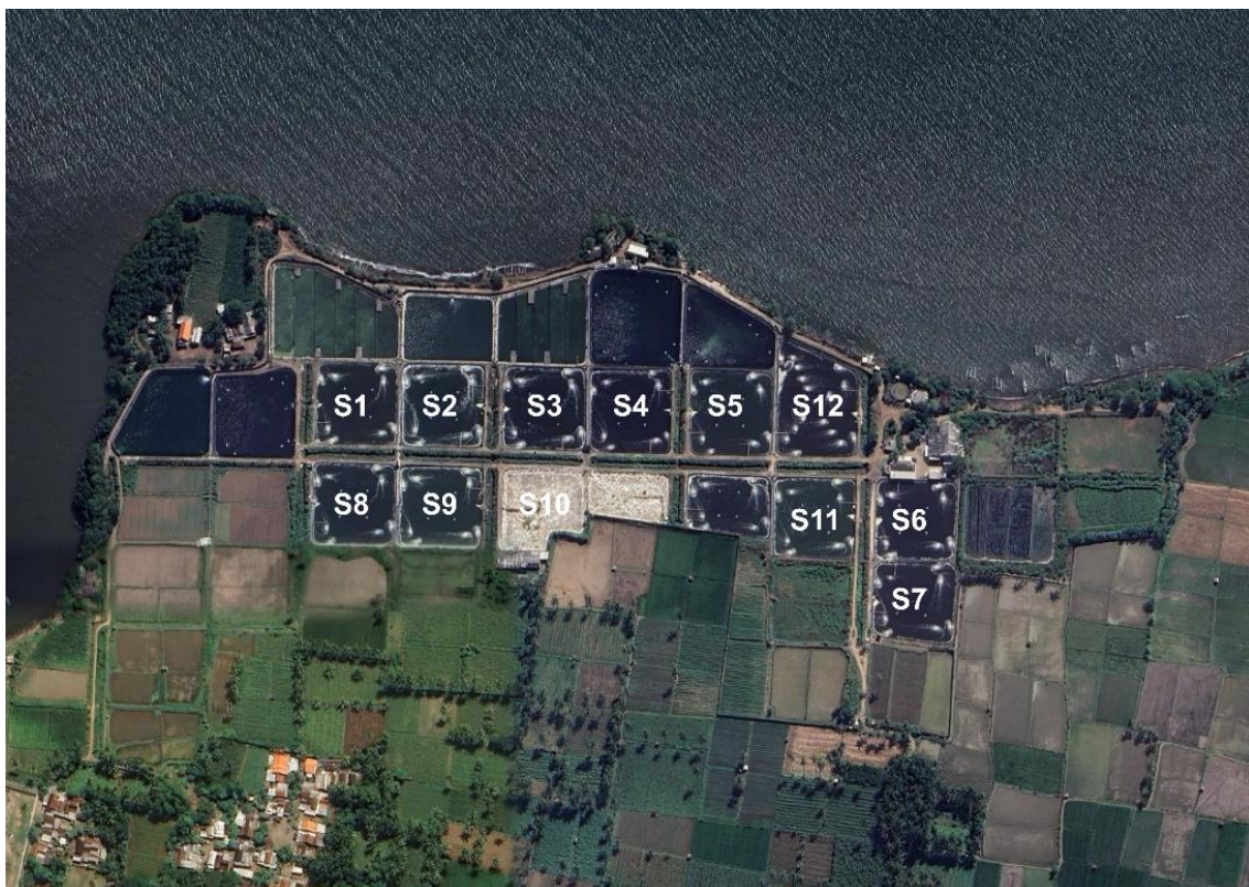
Gambar 2. Titik kolam pengambilan sampel

Pengambilan sampel dilakukan selama satu siklus (DOC 30, 60, 90 dan 120), sedangkan titik pengambilan sampel air pada bagian Inlet (saluran masuk air), central (tengah kolam) dan outlet (saluran keluar air) dengan total keseluruhan 12 kolam, terlihat pada Gambar 2. Metode pengambilan sampel data primer menggunakan dua botol sampel kapasitas 600 ml, setelah itu dianalisis menggunakan metode spektrofotometri dengan satuan miligram per liter (mg/L). Pengamatan sampel plankton menggunakan mikroskop binokuler Olympus CX-23 LED menggunakan perbesaran 400 kali dengan metode haemocytometer dengan satuan sel per mililiter (sel/ml). Adapun perangkat lunak yang digunakan untuk mengolah dan menganalisis data yaitu Microsoft Excel .