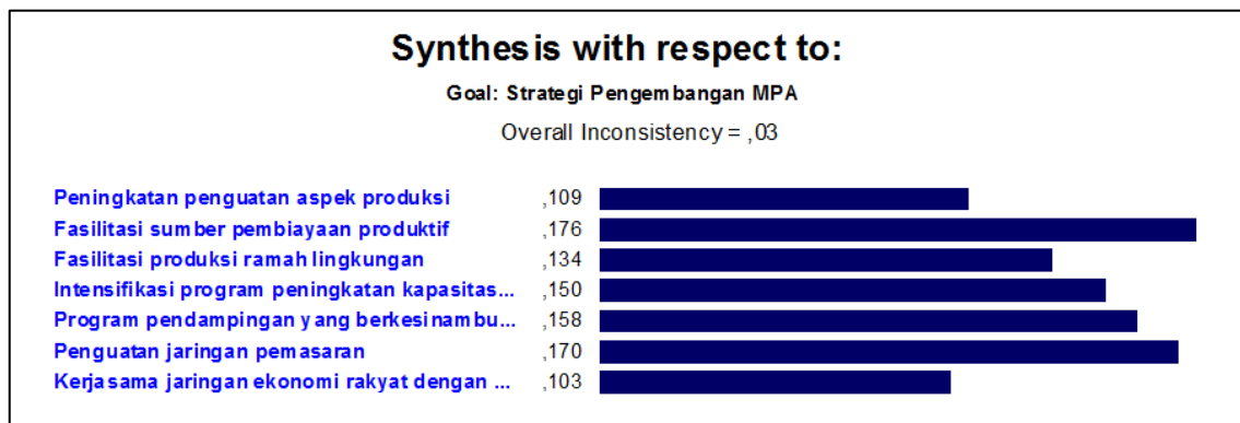
Gambar 2. Hasil Penilaian AHP/ Figure 2. AHP Assesment Result