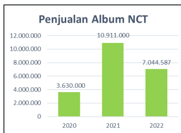
Gambar 1.2. Penjualan Album NCT

Keloyalan para penggemar dinilai menguntungkan oleh agensi-agensi K-POP sehingga berbagai merchandise dan album sering dikeluarkan oleh agensi untuk meraup keuntungan untuk meningkatkan penjualan yang sempat menurun. Hal tersebut juga dimanfaatkan oleh K-POP Store untuk saling bersaing mendapatkan konsumen. Selain karena penurunan dan kenaikan penjualan album NCT, ada persaingan K-POP store antara satu dan lainnya untuk mendapatkan pembeli sangat sengit dapat dilihat dari banyaknya K-POP store yang bermunculan.